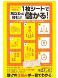
【大谷由里子氏著】 【共著】 【河辺よしろう氏著】