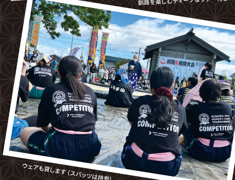
ウェアも貸します (スパッツは持参)