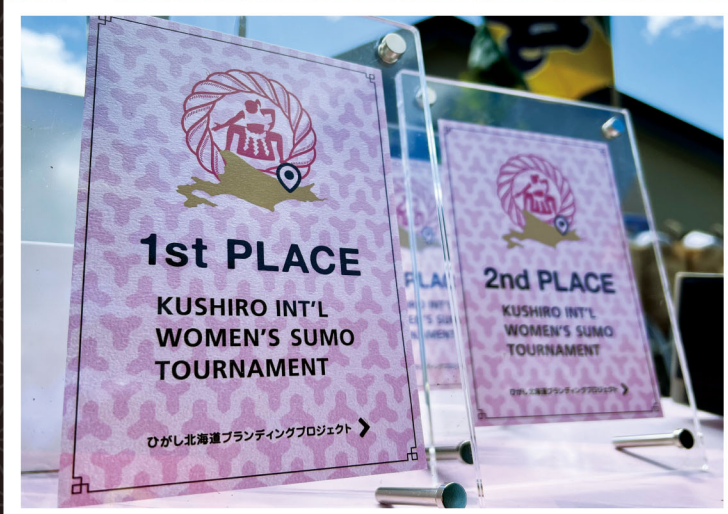
一度負けても試合は何度もあります