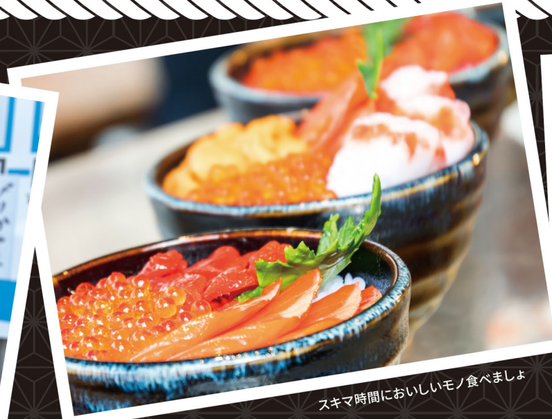
スキマ時間においしいモノ食べましょ