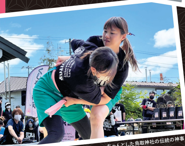
ちゃんとした鳥取神社の伝統の神事