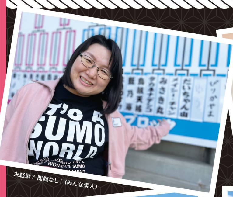
未経験? 問題なし! (みんな素人)